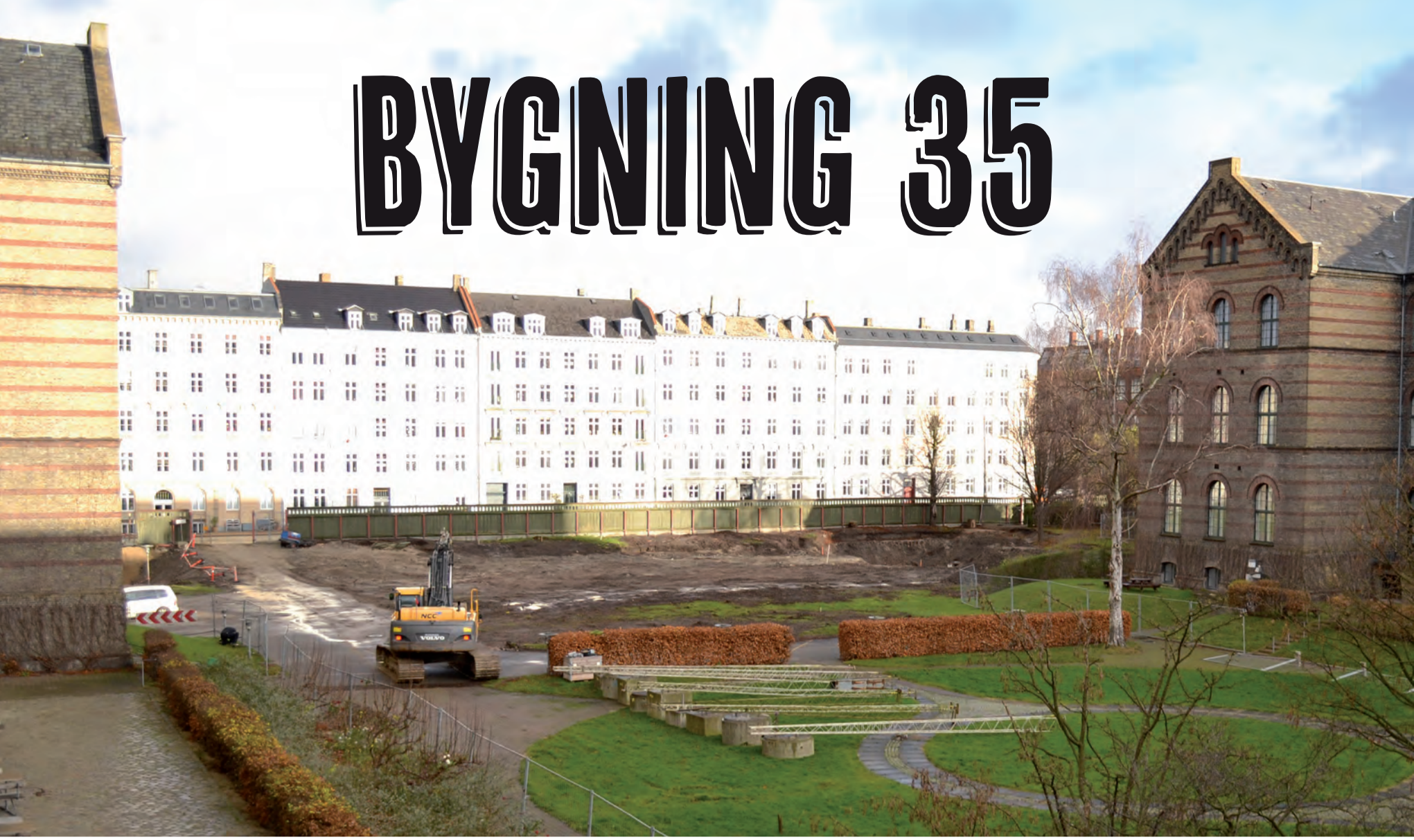
OMRÅDET FØR OPFØRELSEN AF BYGNING 35

I forbindelse med udflytningen af CSS fra Indre By til det gamle Kommunehospital er en ny bygning blevet færdig på Kommunehospitalets gamle areal. Bygningen huser Økonomisk Institut og flere fakultetsfunktioner for CSS samt en integreret børneinstitution på 5 stuer. Den nye bygning har et anderledes formsprog, men er holdt i en stil, der låner fra de gamle hospitalsbygningers arkitektur. Murværket og tagformen betegner arkitekterne som en moderne fortolkning af Christian Hansens byzantinsk-inspirerede arkitektur med gavle, frontispicer, mm.