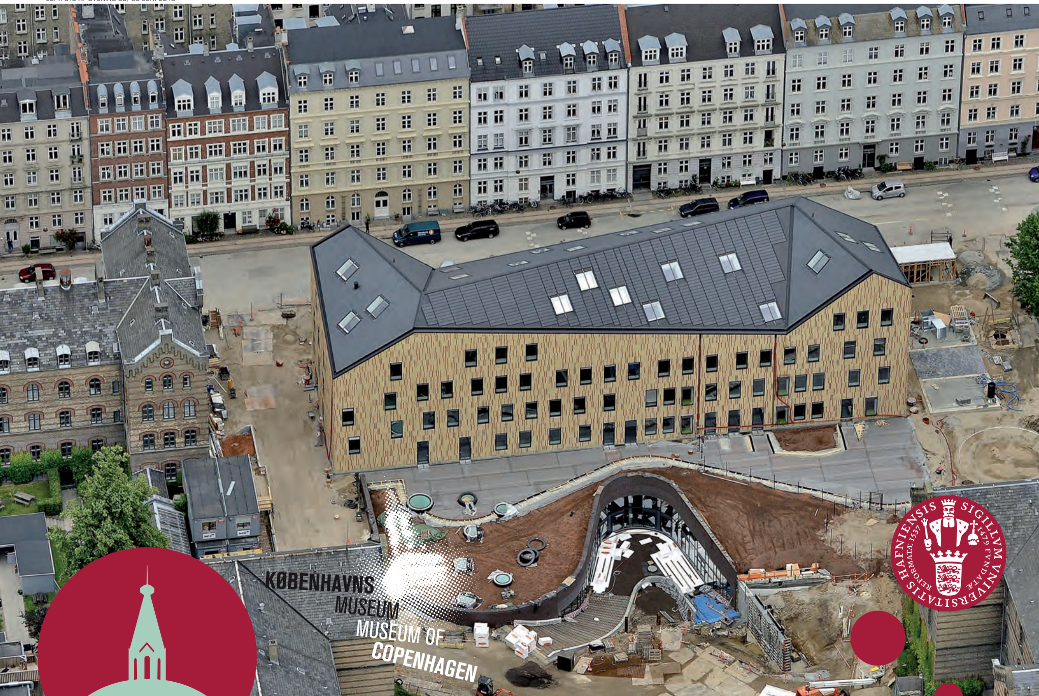
LUFTFOTO AF BYGNING 35, 30 JUNI 2013